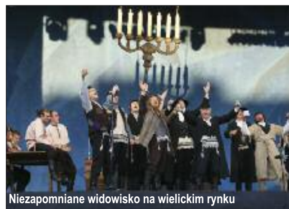
Niezapomniane widowisko na wielickim rynku