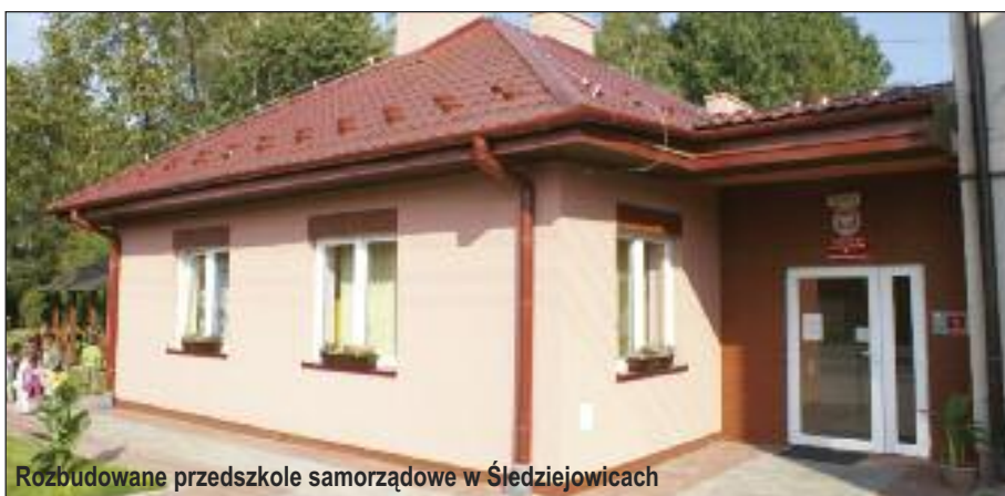
Rozbudowane przedszkole samorządowe w Śledziejowicach