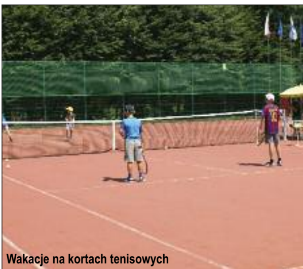
Wakacje na kortach tenisowych

Aby stworzyć trwałą bazę dla wydarzeń sportowych, gmina zainwestowała w infrastrukturę sportową blisko 50 mln zł. Dzięki temu w Wieliczce można już zagrać w piłkę nożną, tenisa ziemnego, wyjść na basen, uczestniczyć w rajdach samochodowych i rowerowych. Aby wspierać utalentowane dzieci i młodzież oraz dać im warunki właściwego rozwoju stworzony został także system stypendialny.