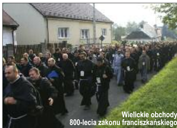
Wielickie obchody 800-lecia zakonu franciszkańskiego