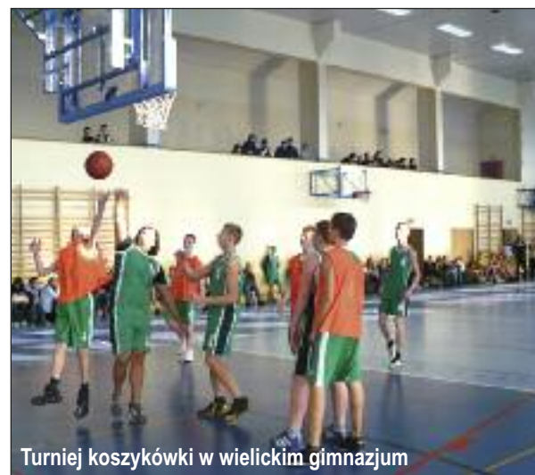
Turniej koszykówki w wielickim gimnazjum