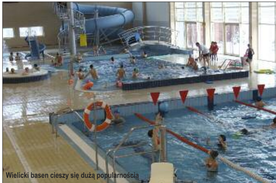
Wielicki basen cieszy się dużą popularnością