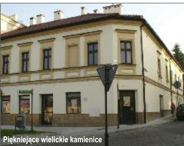
Pięknijące wielickie kamienice