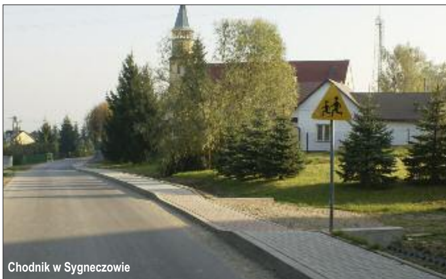
Chodnik w Sygnezowie