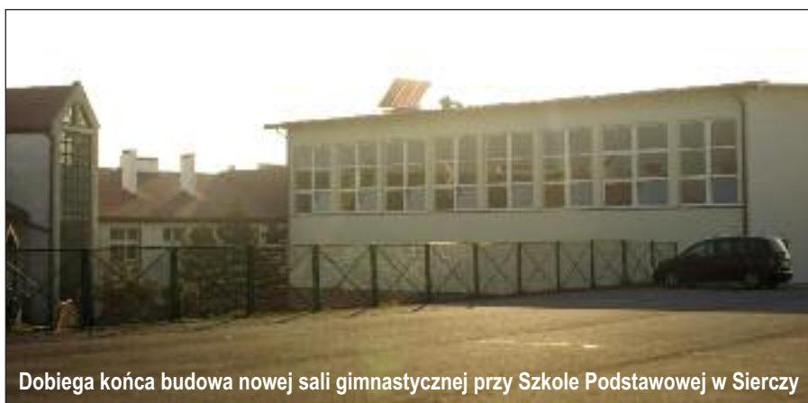
Dobiega końca budowa nowej sali gimnastycznej przy Szkole Podstawowej w Sierczy