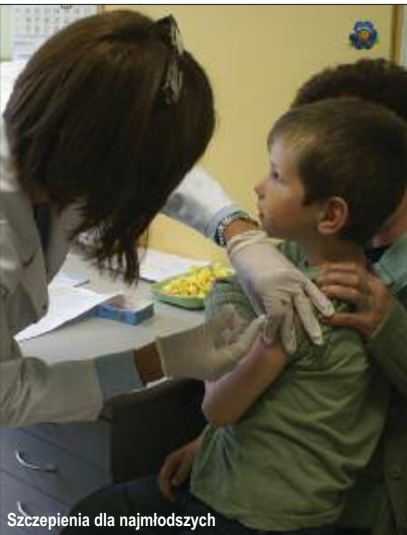
Szczepienia dla najmłodszych