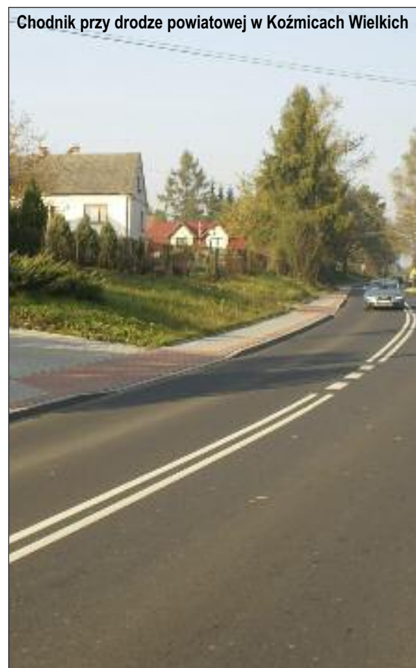
Chodnik przy drodze powiatowej w Koźmicach Wielkich