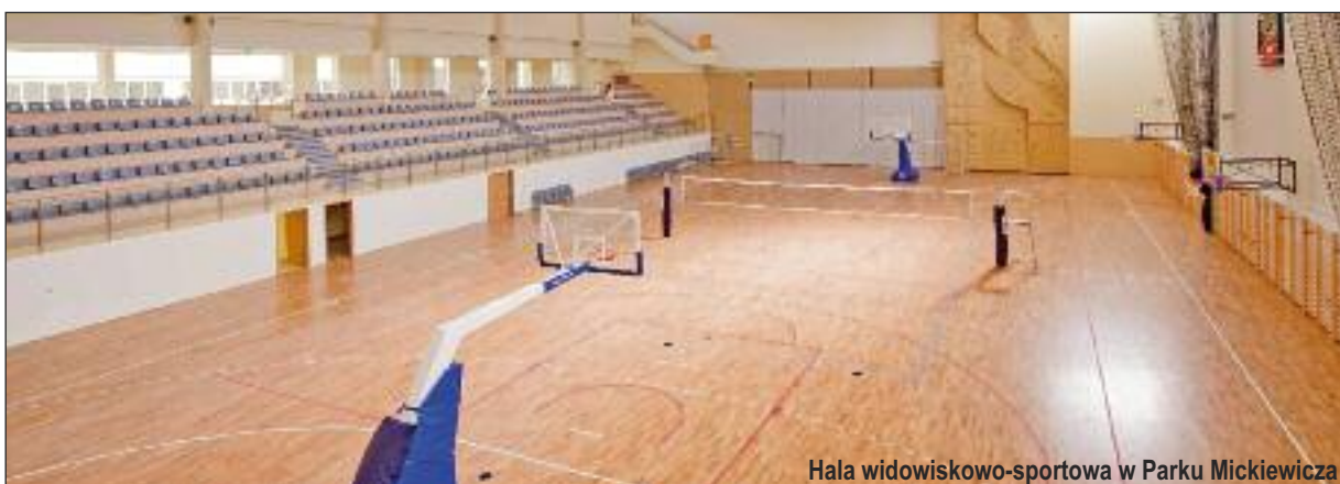
Hala widowiskowo-sportowa w Parku Mickiewicza