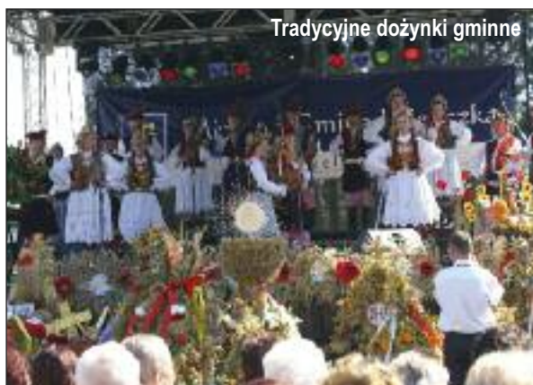
Tradycyjne dożynki gminne