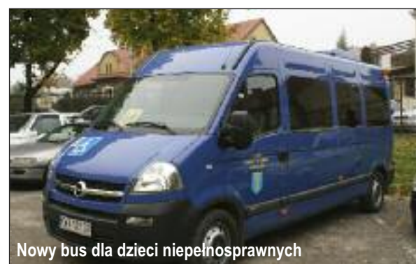
Nowy bus dla dzieci niepełnosprawnych