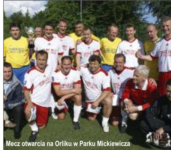
Mecz otwarcia na Orliku w Parku Mickiewicza