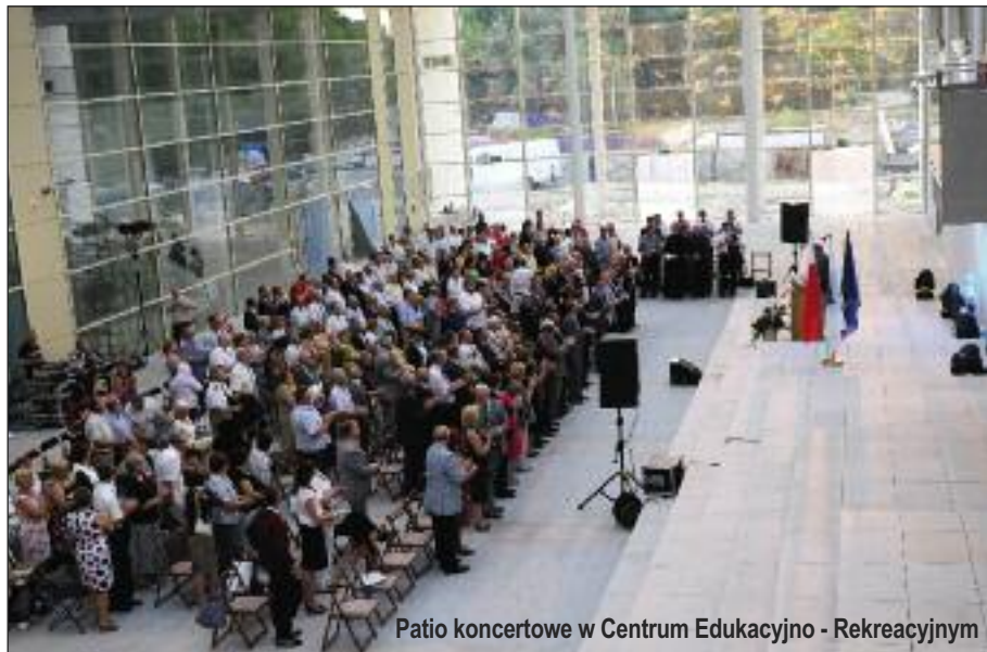
Patio koncertowe w Centrum Edukacyjno - Rekreatywnym