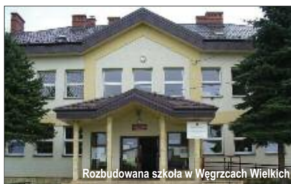
Rozbudowana szkoła w Węgrzcach Wielkich