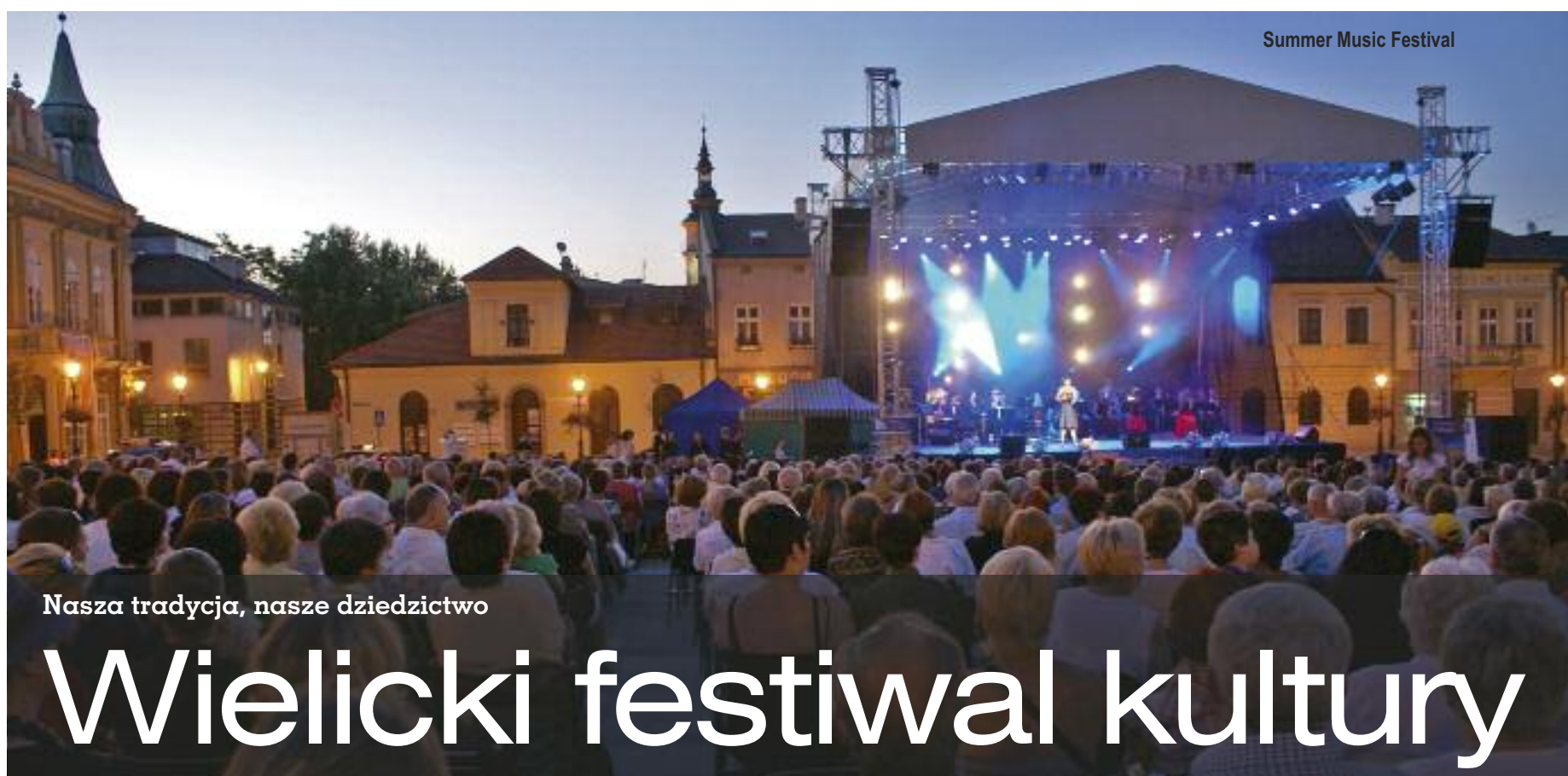
Summer Music Festival