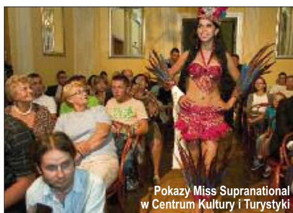
Pokazy Miss Supranational w Centrum Kultury i Turystyki