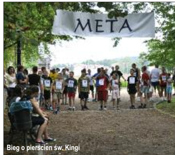
Bieg o pierścien św. Kingi