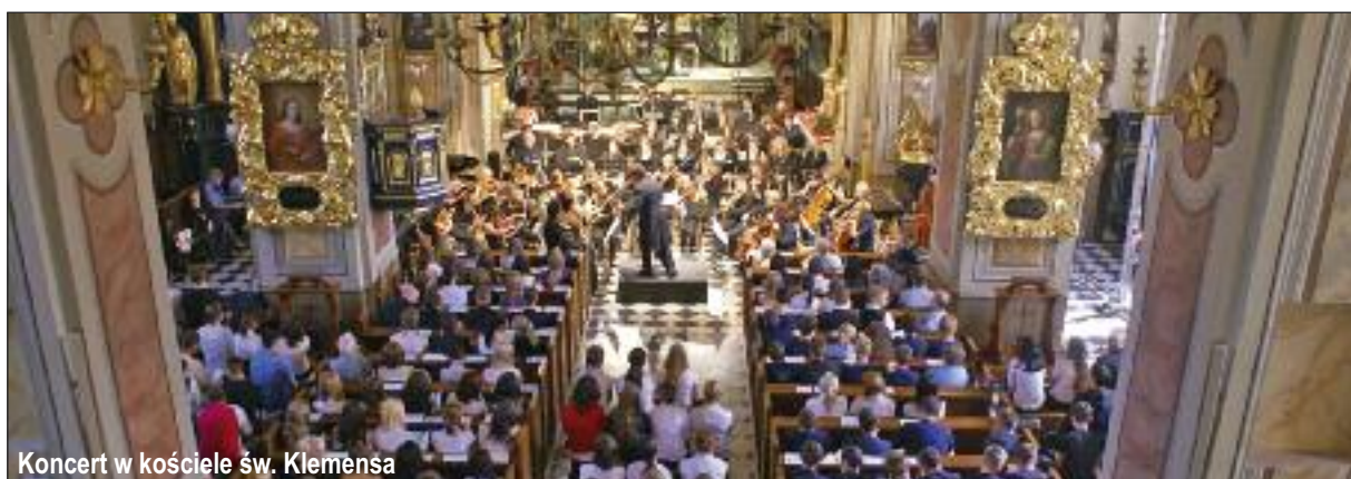
Koncert w kościele św. Klemensa

Do najpopularniejszych wydarzeń należą: Spotkanie noworoczne, Summer Music Festival, Dni św. Kingi, Miodobranie, Dożynki Gminne, Dzień dziecka, Forum ekonomiczne w Krynicy, Salt Cup, Festiwal Muzyki Dawnej oraz koncerty w ramach cyklu „Zapraszamy do Wieliczki”.