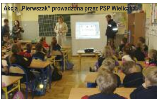
Akcja „Pierwszak” prowadzona przez PSP Wieliczka