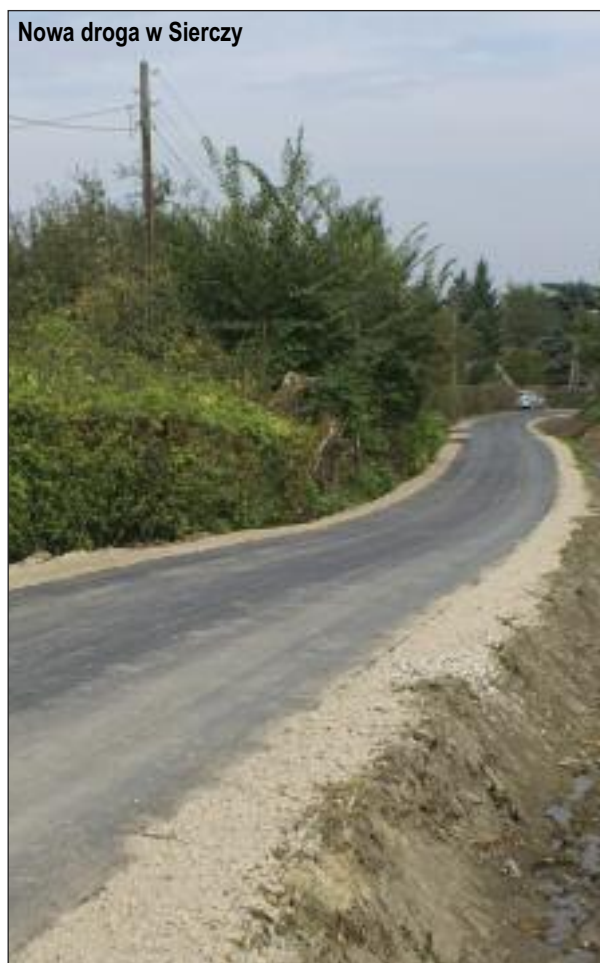
Nowa droga w Sierczy