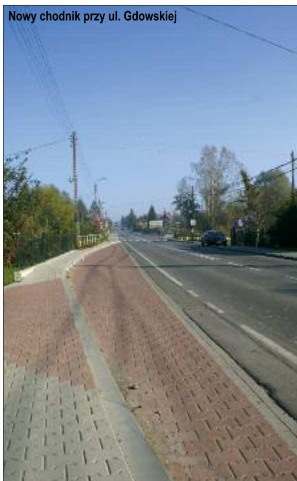
Nowy chodnik przy ul. Gdowskiej