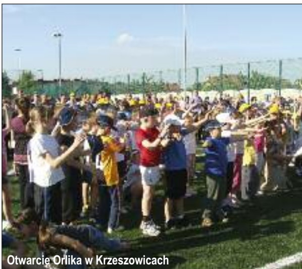
Otwarcie Orlika w Krzeszowicach