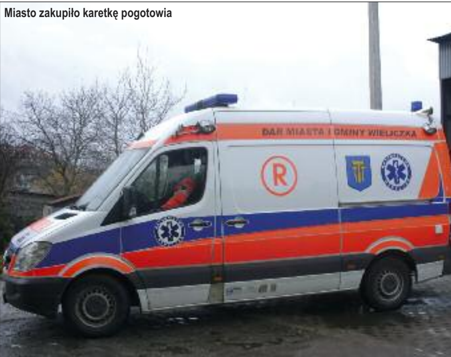
Miasto zakupiło karetkę pogotowia