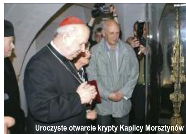
Uroczyste otwarcie krypty Kaplicy Morsztynów