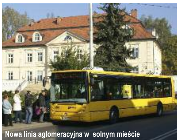
Nowa linia aglomeracyjna w solnym mieście