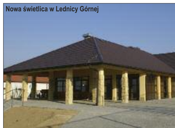
Nowa świetlica w Lednicy Górnej