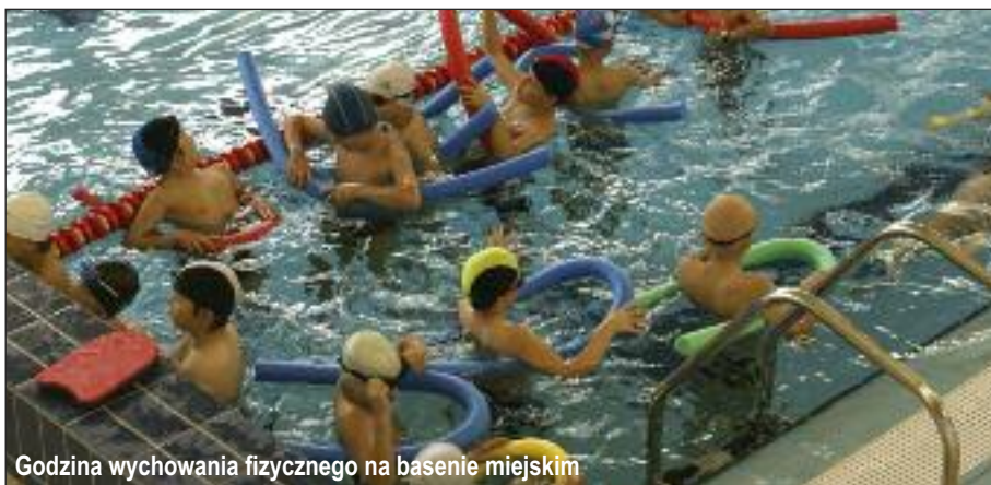
Godzina wychowania fizycznego na basenie miejskim

Ponadto gmina ponosi indywidualnie koszty dowozu dzieci do szkół. Systematycznie podejmuje także działania w celu stałego podnoszenia jakości kształcenia, wychowania, ale i bezpieczeństwa uczniów. W celu poprawy warunków nauczania każdego roku w placówkach szkolnych i przedszkolnych prowadzone są remonty czy też niezbędne rozbudowy. Najzdolniejsi uczniowie w gminie Wieliczka rokrocznie otrzymują całoroczne Stypendia im. Jana Pawła II.