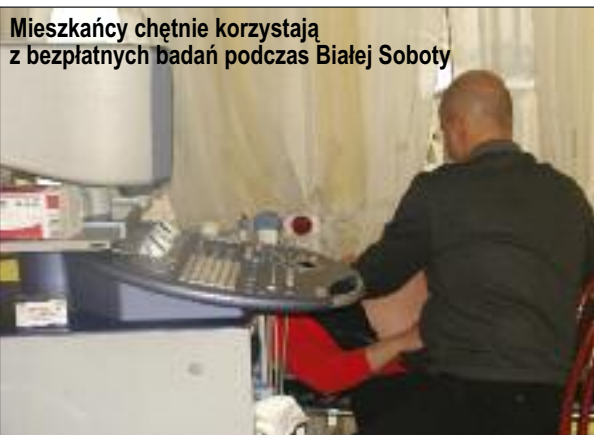
Mieszkańcy chętnie korzystają z bezpłatnych badań podczas Białej Soboty