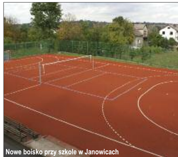
Nowe boisko przy szkole w Janowicach