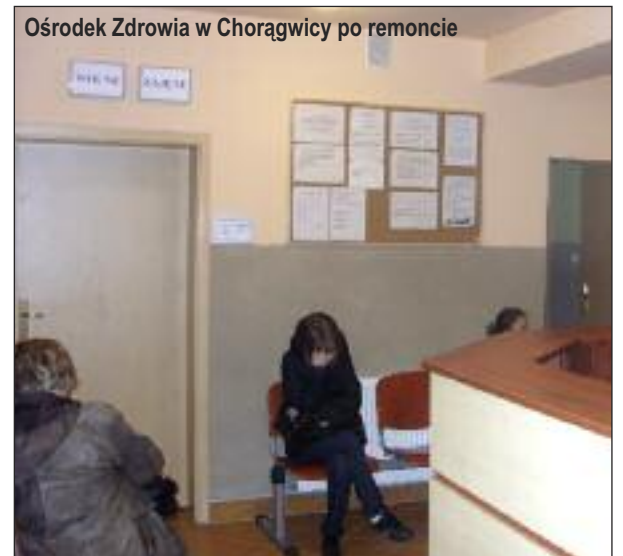
Ośrodek Zdrowia w Chorągwicy po remoncie