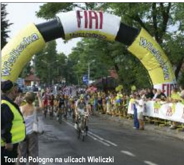
Tour de Pologne na ulicach Wieliczki