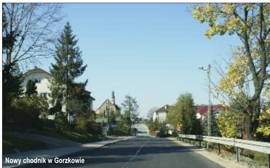
Nowy chodnik w Gorzkowie