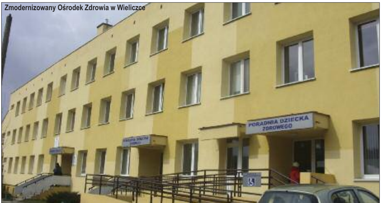
Zmodernizowany Ośrodek Zdrowia w Wieliczce