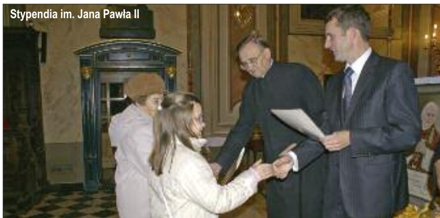
Stypendia im. Jana Pawła II