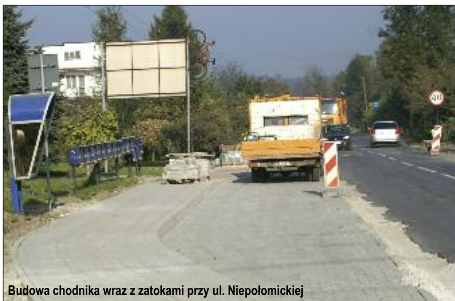
Budowa chodnika wraz z zatokami przy ul. Niepołomickiej