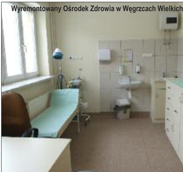
Wyremontowany Ośrodek Zdrowia w Węgrzcach Wielkich