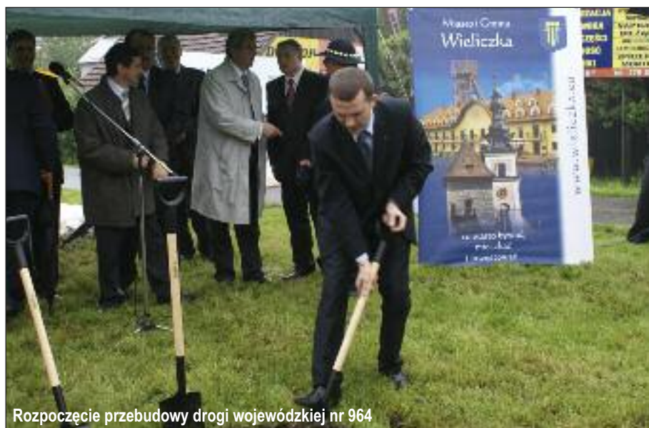
Rozpoczęcie przebudowy drogi wojewódzkiej nr 964

Od 2009 przez najbliższe 5 lat realizowany będzie program nazywany potocznie „1 mln zamiast kamienia”, który polega na poprawie dróg dojazdowych z uregulowaną własnością poprzez wykonywanie na drogach szutrowych nakładek asfaltowych.