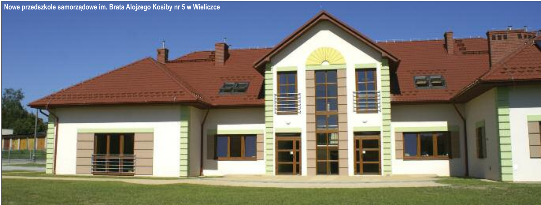
Nowe przedszkole samorządowe im. Brata Alojzego Kosiby nr 5 w Wielicze

Remonty placówek i stypendia dla najzdolniejszych