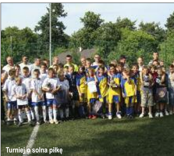
Turniej o solna piłkę