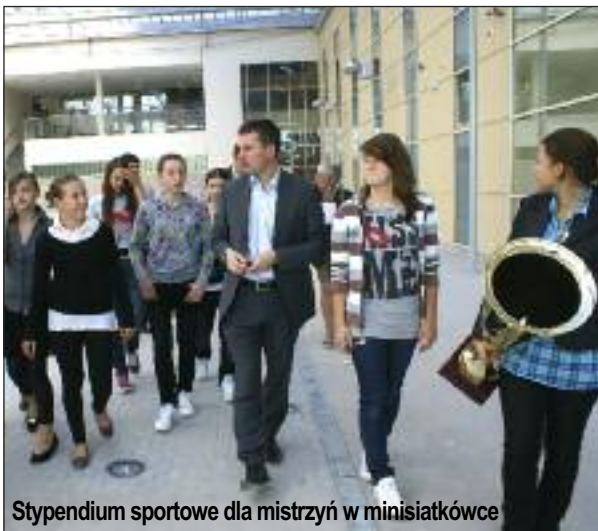
Stypendium sportowe dla mistrzyń w minisiatkówce