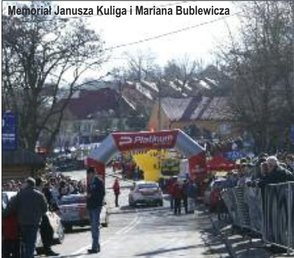
Memorial Janusza Kuliga i Mariana Bublewicza