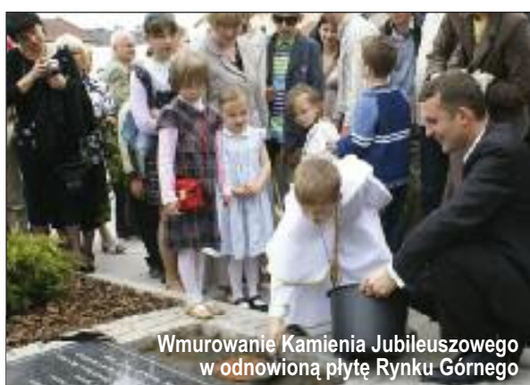
Wmurowanie Kamienia Jubileuszowego w odnowioną płytę Rynku Górnego