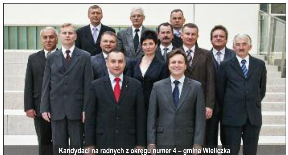
Kandydaci na radnych z okręgu numer 4 – gmina Wieliczka