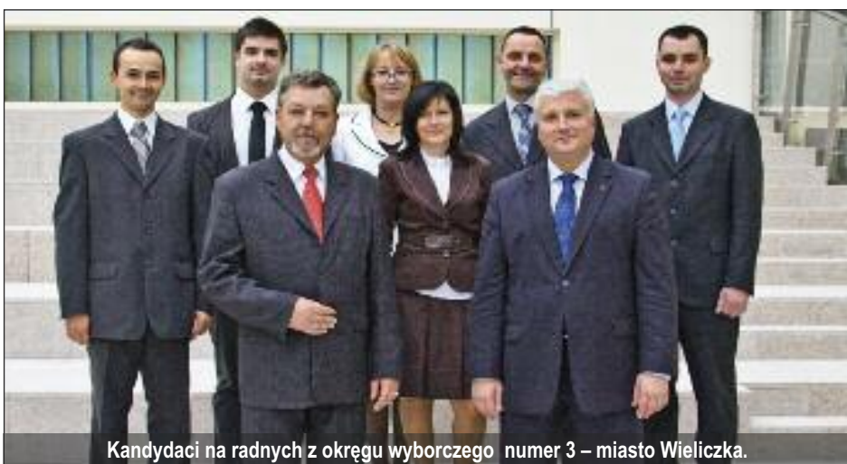
Kandydaci na radnych z okręgu wyborczego numer 3 – miasto Wieliczka.

Coraz większą kwotę będą stanowiły wydatki inwestycyjne, czyli te, dzięki którym realizujemy bezpośrednio Państwa potrzeby.